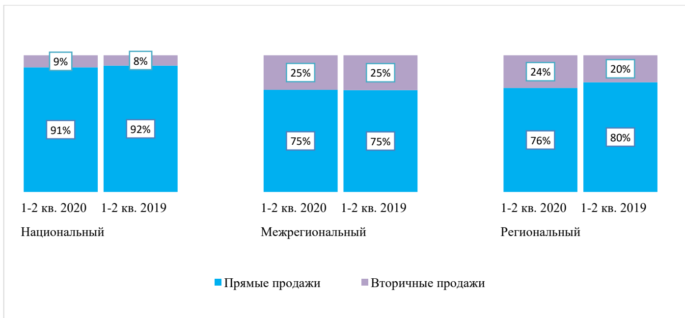
Рисунок составлен на основании данных дистрибьюторов, участвующих в рейтинге

Динамика изменения структуры поставок дистрибьюторов, 1-2 кв. 2020 года/1-2 кв. 2019 года