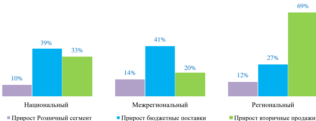
Рисунок составлен на основании данных дистрибьюторов, участвующих в рейтинге

Сравнение прироста объемов продаж по каналам сбыта, 1-2 кв. 2020 года/1-2 кв. 2019 года